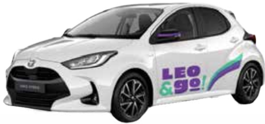
Toyota Yaris hybride